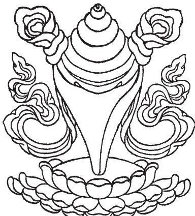
བུད་དགས།