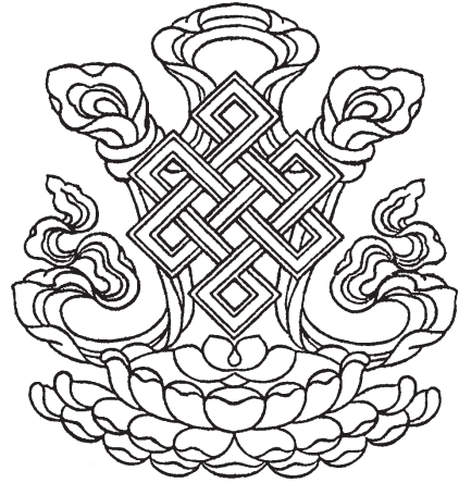
དཔལ་བེའུ།