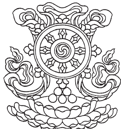
འཁོར་ལོ།